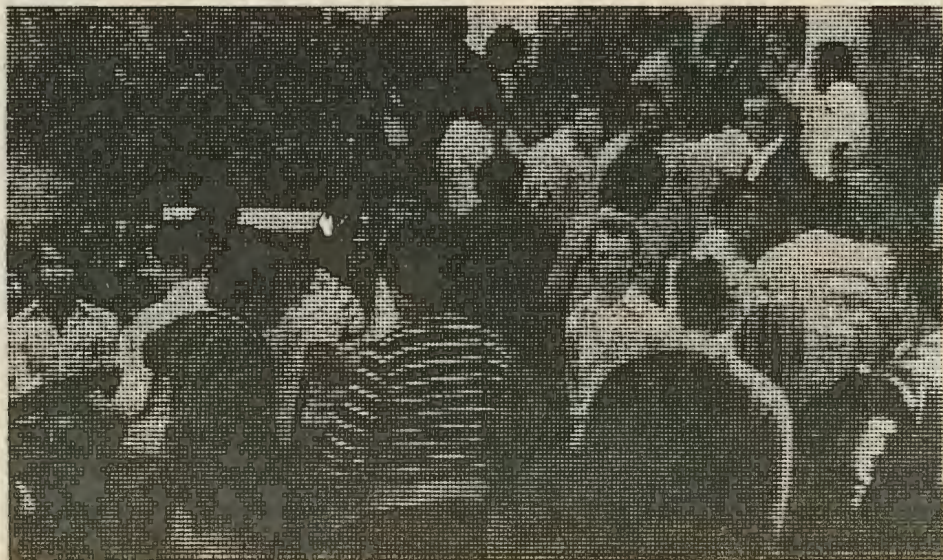
...Οι άνεργοι εργάτες ξενητεύονται